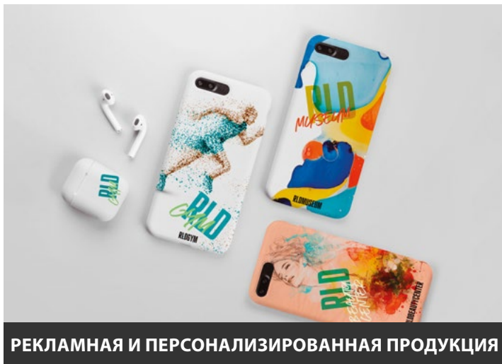
РЕКЛАМНАЯ И ПЕРСОНАЛИЗИРОВАННАЯ ПРОДУКЦИЯ