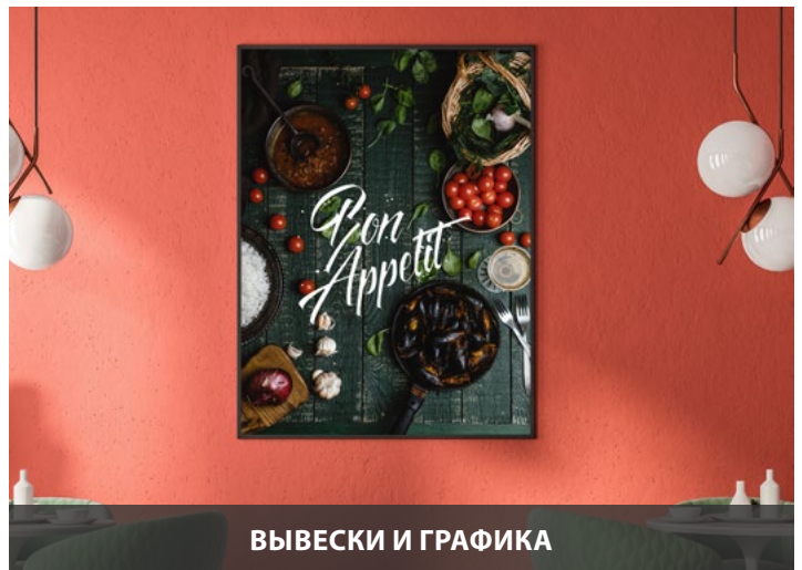
ВЫВЕСКИ И ГРАФИКА