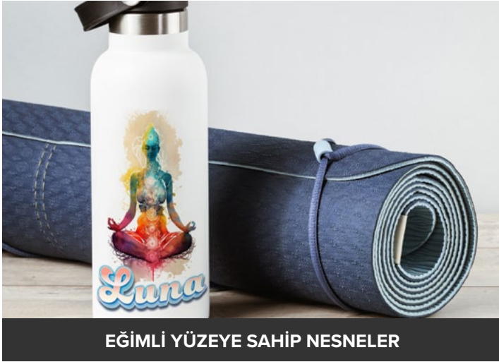
EĞİMLİ YÜZEYE SAHİP NESNELER