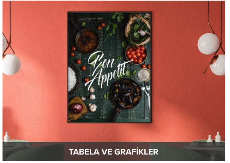
TABELA VE GRAFİKLER