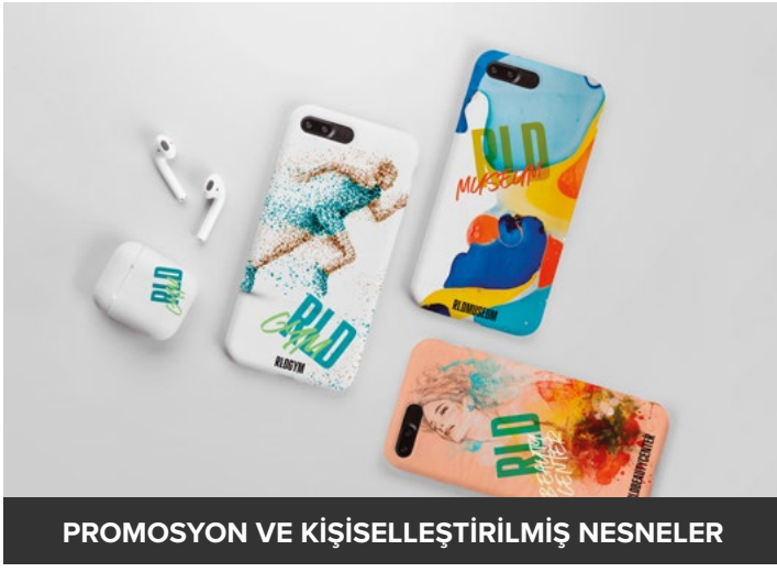
PROMOSYON VE KİŞİSELLEŞTİRİLMİŞ NESNELER